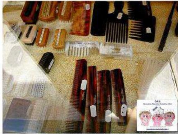
Pettini stretti a Parigi

La parola “prevenzione” nel campo della pediculosi ha un significato preciso su cui bisogna intenderci tutti. Nonostante le varie ricerche sperimentali, non è stata ancora scoperta una medicina capace di rendere inattaccabile la testa di bimbi o adulti. In altre parole un “repellente” o una specie di vaccino contro i pidocchi, capace di impedire la malattia, non esiste ancora. Allora che significa prevenzione? Al momento può significare solo “diagnosi precoce” e limitazione delle complicanze (prevenzione secondaria). In commercio si trovano alcuni prodotti che si “sforzano” di creare un ambiente sfavorevole per il pidocchio ma purtroppo c’è ancora molto da studiare in questo campo.